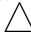
Стиль – «Рисунок»

Основной текст тезисов. Ххххх ххх хххххххх хххх. Хх хххх [1], хххххх хххххххх. Хххххх хххххххх хххххххххх [2]. Ххххх (рис. 1) хххххххх хх хххххххххх. Хххххх ххххх ххх (табл. 1). (Стиль – «Обычный»)